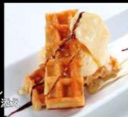
ハニーワッフル アイスクリーム添え