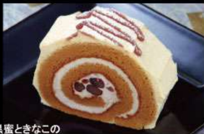
黒蜜ときなこの ロールケーキ