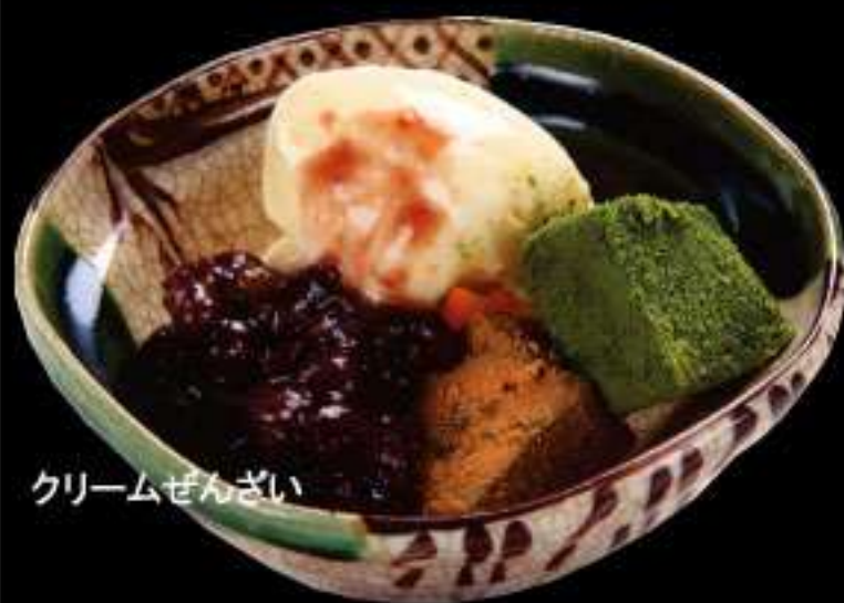
クリームぜんざい