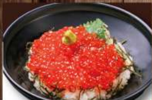
17 いくら丼 ○○○○○○ 6,500円