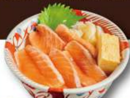
18 サーモン丼 ○○○ 3,900円