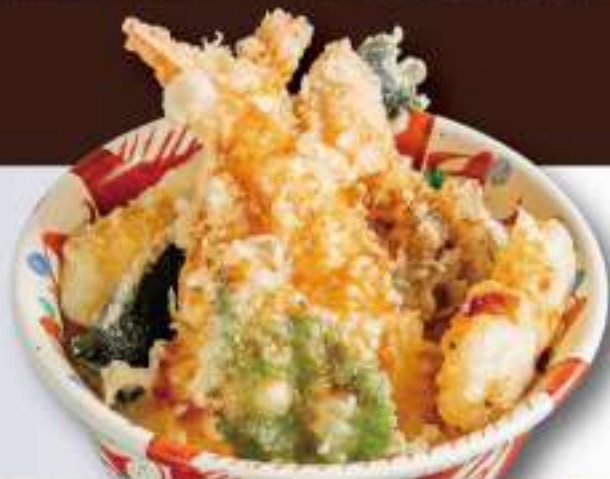
19 海鮮天丼 ○○○○○○○○ 3,300円