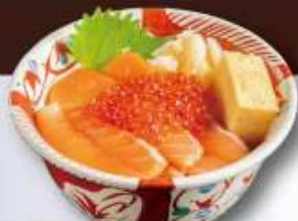
16 サーモンいくら丼 4,500円