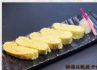
③2 玉子焼き 700円 お店で手作り