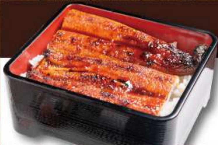
15 うなぎ ○○○○○○○○ 7,700円