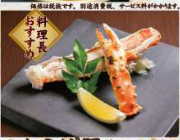
③0 たらば蟹焼き 13,000円 価格は税抜です。別途消費税、サービス料がかかります。