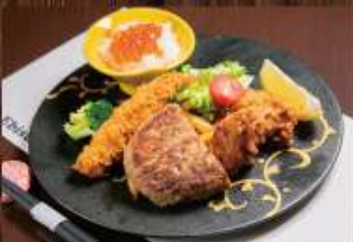
20 お子様プレート 1,800円