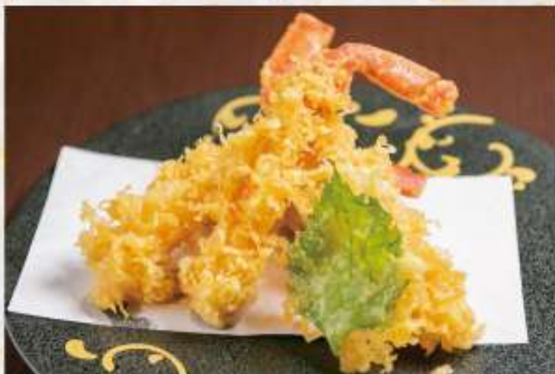
②6 すわりの蟹天ぷら 5,800円 価格は税抜です。別途消費税、サービス料がかかります。