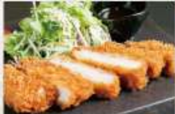
②4 トンカツ 2,500円 価格は税抜です。別途消費税、サービス料がかかります。