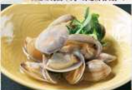
②8 あまりの酒蒸し 1,800円 価格は税抜です。別途消費税、サービス料がかかります。