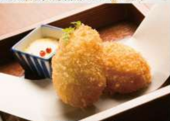
②7 カニクリームコロッケ 1,500円(税込) 価格は税抜です。別途消費税、サービス料がかかります。