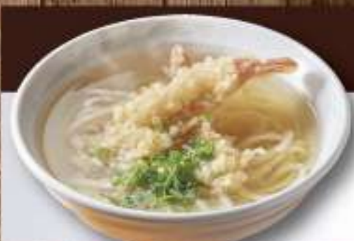
22 天ぷらうどん ○○○ 1,800円