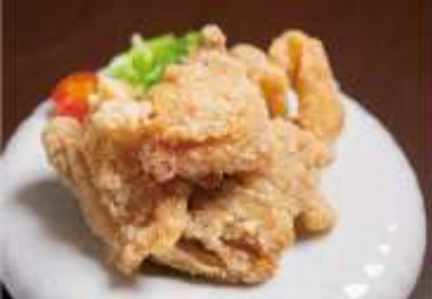
②5 釧路ザンギ 1,200円 価格は税抜です。別途消費税、サービス料がかかります。