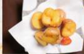
②3 ポテトフライ 900円 価格は税抜です。別途消費税、サービス料がかかります。