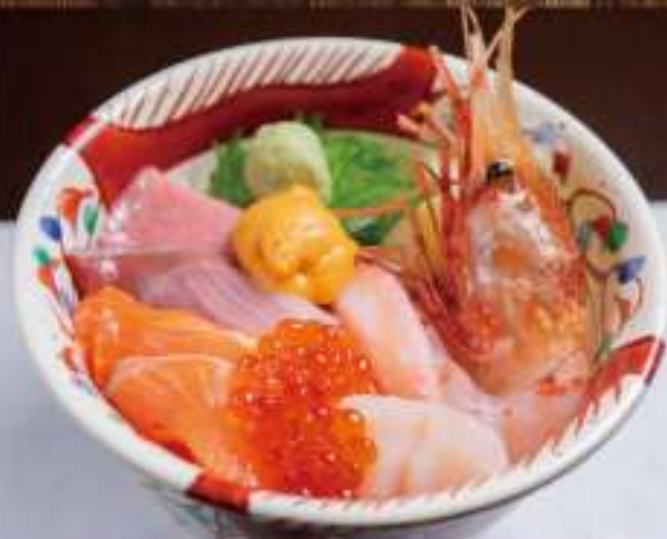
11 海鮮丼 ○○○○○○○○ 6,500円