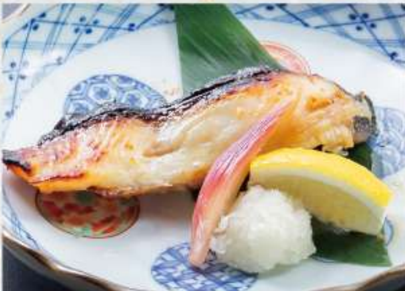
②9 銀鱈西京焼き 1,800円 価格は税抜です。別途消費税、サービス料がかかります。