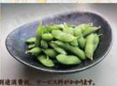
③1 枝豆 700円