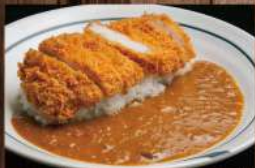
21 カツカレー ○○○○○○ 1,800円